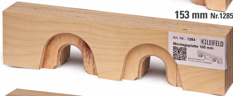
100 mm Nr.1284