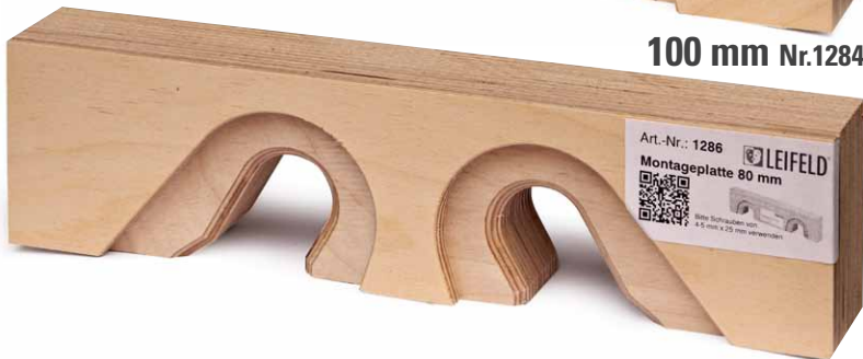
80 mm Nr.1286