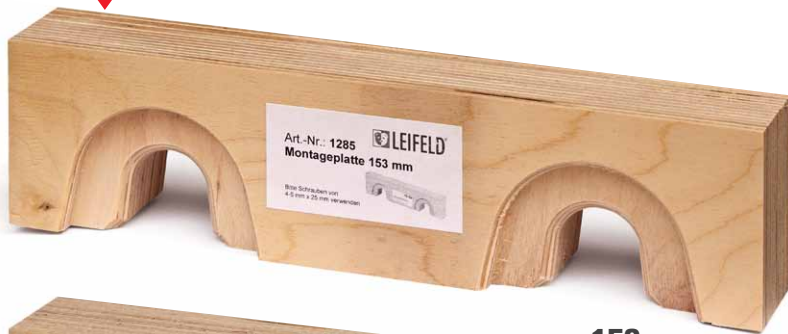
153 mm Nr.1285