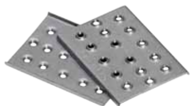
mit Gewinde - Fixierplättchen M5