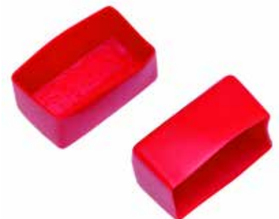
Art.Nr.: 1320 C-Profil Endkappen