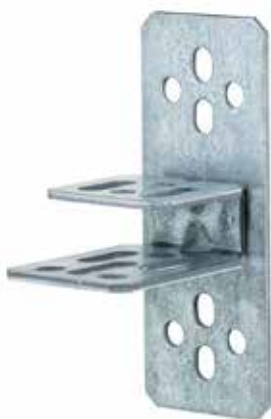
Art.Nr.: 1311 C-Profilanschluss V, vertical