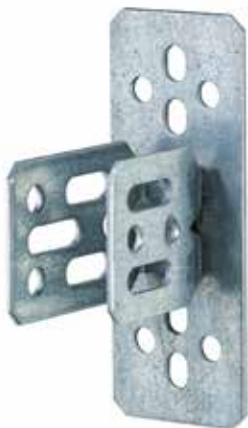
Art.Nr.: 1310 C-Profilanschluss H, horizontal